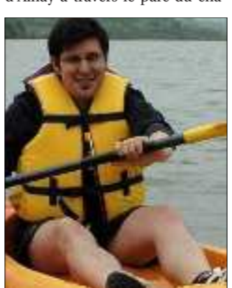
Une balade en canoë vous tente ? Rendez-vous au lac de Virlay route de Bourges.

demain Vieille ville de Saint-Amand. – Partez à la découverte de la vieille ville de Saint-Amand-le-Chastel, le plus ancien noyau de l'agglomération, puis Saint-Amand-sous-Montrond... Rendez-vous à 21 h 30, devant le musée Saint-Vic. Tarifs : adultes 3 €, enfants 1,50 €. Eglise de Saint-Amand. – Visite commentée et découverte de l'or-