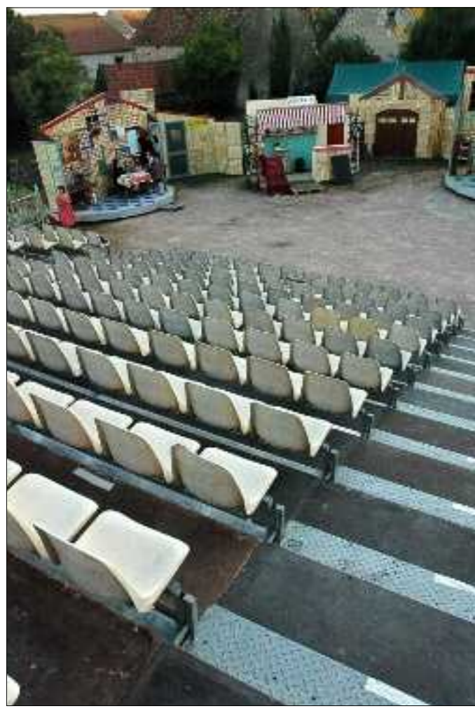
Le public du Livre vivant se divise en deux catégories il y a les vacanciers, de passage dans la région et les habitués, qui réservent parfois le même siège, d’une année sur l’autre !

L’aventure dure depuis 23 ans. Chaque été, le cœur de Vesdun bat au rythme du Livre vivant. Un rendez-vous qui n’existerait pas sans les bénévoles, qui œuvrent sur scène et en coulisse.