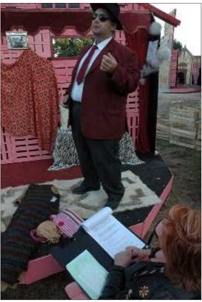
La troupe compte une trentaine de comédiens mais en réalité c'est le double de bénévoles qui s'impliquent dans la création du Livre vivant.

Rendez-vous à Vesdun, ce soir, pour la première. De 6 à 8 €, le spectacle démarre à la tombée de la nuit.